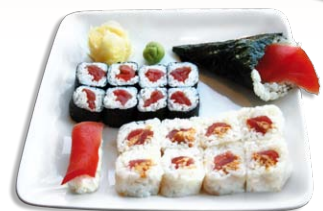
106 Tokio Tuna