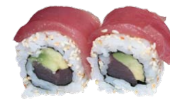
Topping Special Rolls