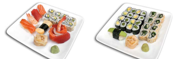
102 Bento 2