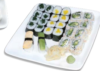
107 Tokio Vego