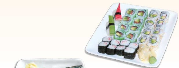
105 Tokio California

108 Tokio Party 16 x gemischte Sashimi scheiben 60,00 € 20 x gemischte Nigiri 6 x gemischte Maki Rollen (geschnitten 48 Stück)